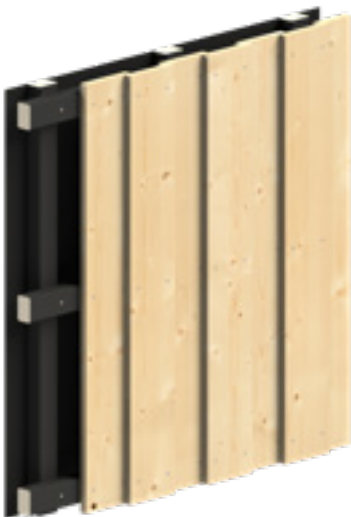
Glattkantprofile, Boden/Deckelschalung 18x143 mm, Fichte gehobelt

Wenn Sie die Fassadenbretter vor der Montage lagern müssen, tun Sie das am besten in der Original Verpackungseinheit unter einer Bedachung im Freien. Auf Unterlegehölzer (mind. 75 mm Höhe) mit einem max. Abstand von 1 m.